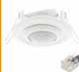
Slave sensor (10m snoer)