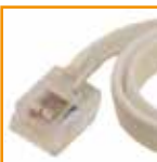
RJ12 kabel (5 meter snoer)